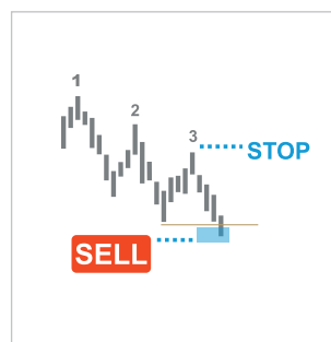
3 Descending Peaks