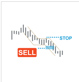
Measured Move Down