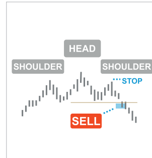
Head and Shoulders